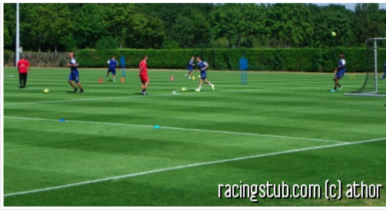
Les ateliers de jongles et de dribbles