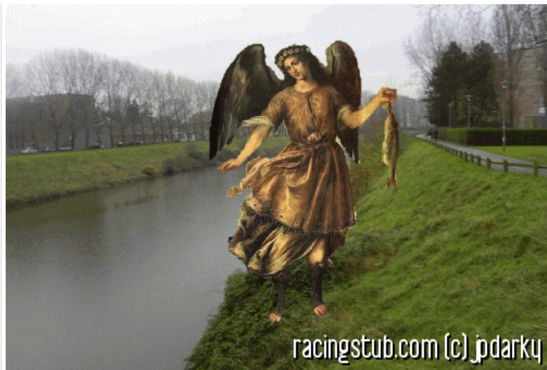
Saint Raphaël fait une belle prise à Dunkerque pour soigner les