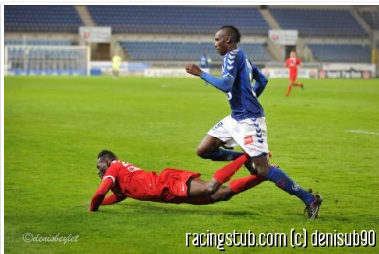
Expression du jour : courir ventre à terre