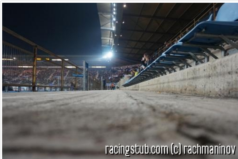
Ambiance champêtre minérale à la Meinau