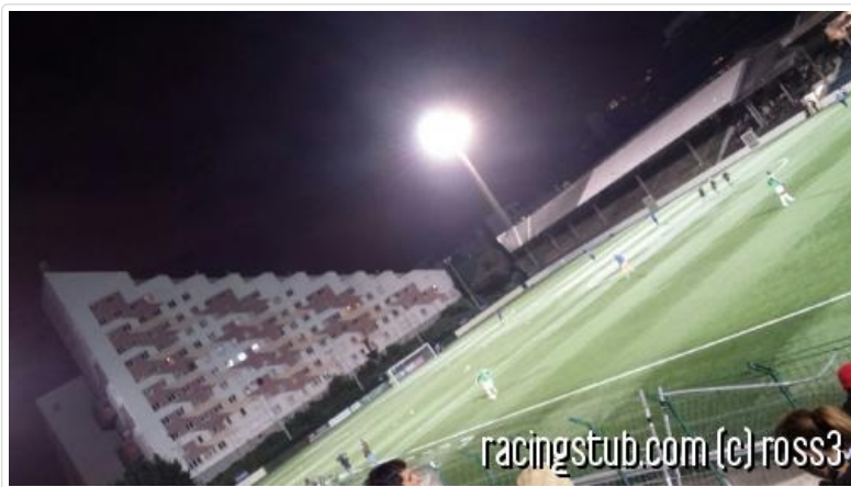
Expérimentation de la FFF : le terrain en pente réussit aux Strasbourgeois