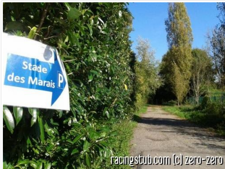
Ambiance champêtre à Chambly