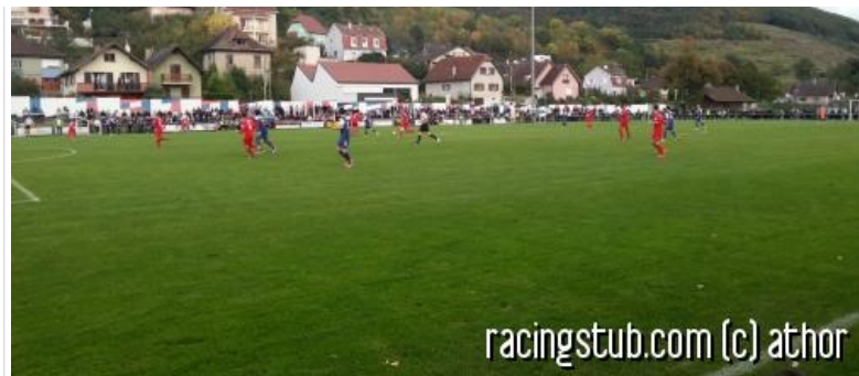
Ambiance champêtre à Guebwiller