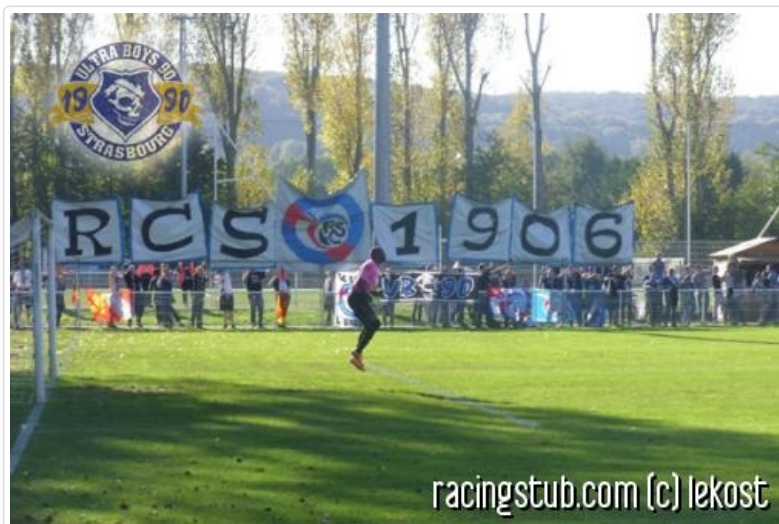
Sans doute le premier tifo de l'histoire du stade de Chambly