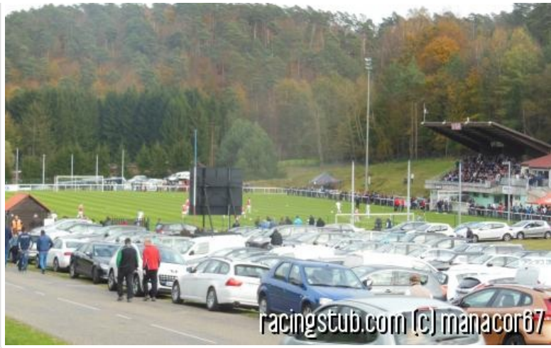
Ambiance champêtre à Reipertswiller