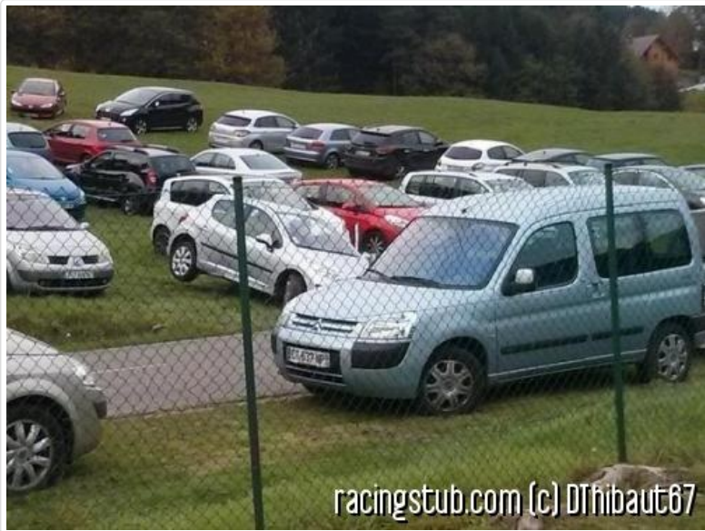
Phénomène étrange : la voiture qui lévite