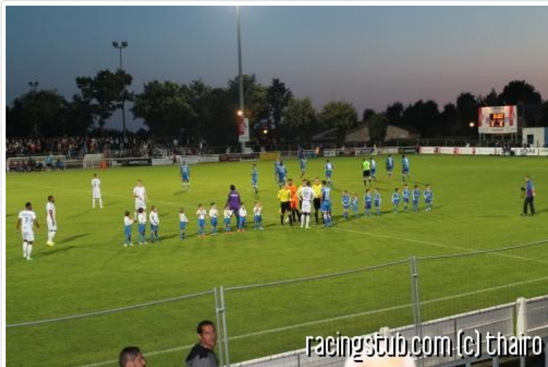
Ambiance champêtre en Vendée

11 octobre : Guebwiller Italiens - Racing