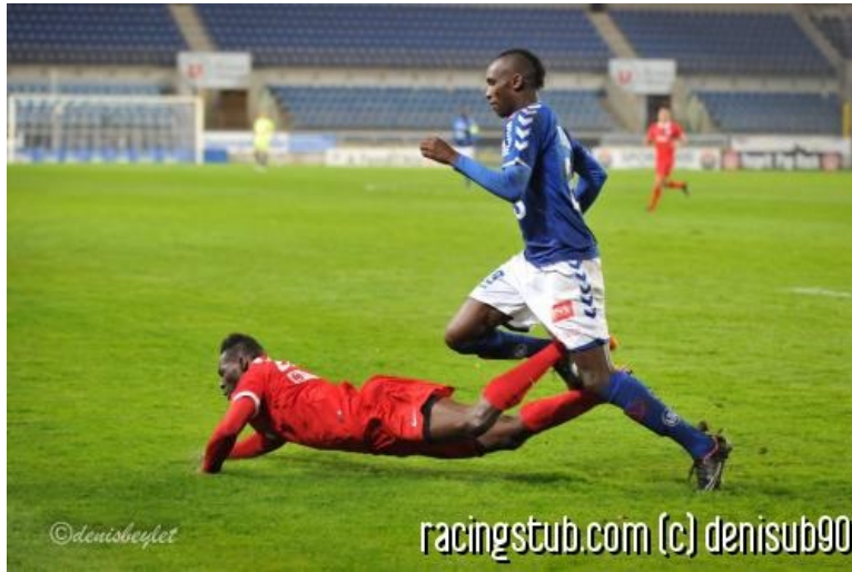
Il y a des joueurs qui ne font pas semblant de courir ventre à terre

★★★★★ (3 notes) 📅 28/12/2014 05:00 📍 Bilan 👁 Lu 12.979 fois 🗨 Par rachmaninov 🗨 4 comm.