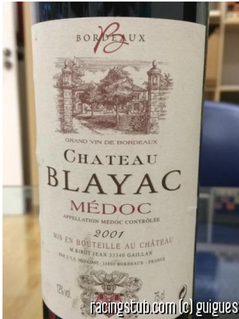
La seule photo de Blayac à notre disposition à ce jour

★★★★★ (4 notes) 📅 13/01/2015 05:00 ↻ Transferts © Lu 17.739 fois 👤 Par athor 🗨️ 8 comm.