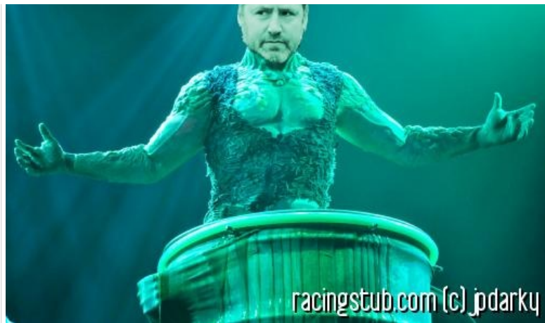
Toxic Sechet Avenger !