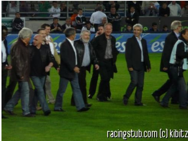
30 ans après, avant le match contre Metz

☆☆☆☆ (0 note) 📅 13/05/2009 05:00 📍 Souvenir/anecdote 👁 Lu 3.262 fois 👤 Par filipe 🗨 0 comm.